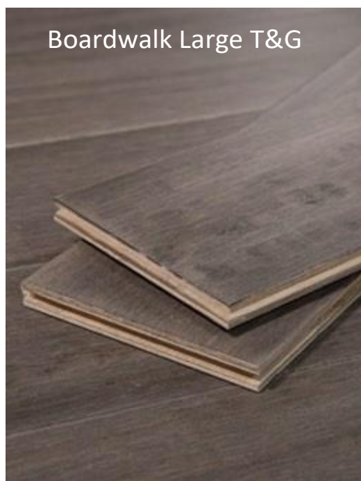
Boardwalk Large T&G