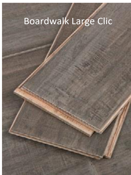
Boardwalk Large Clic